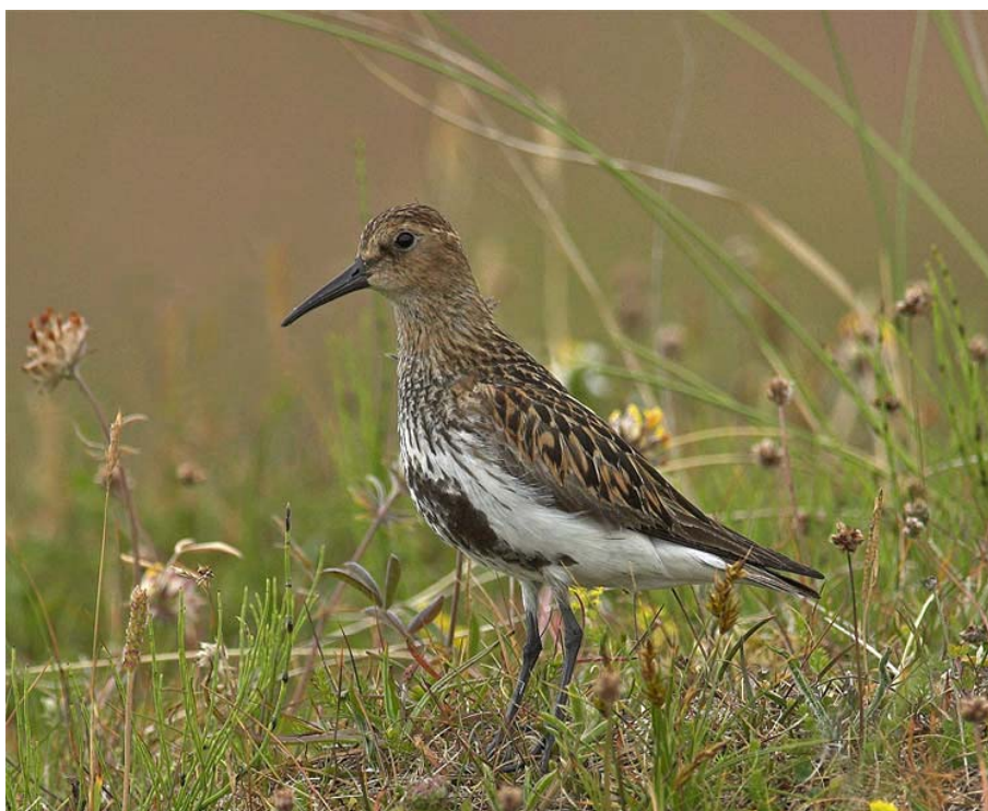
Foto 4. Engryle i karakteristisk ynglehabitat. Arten er tilknyttet kort, åben vegetation på enge, og flere af de engområder i Vadehavet, hvor arten tidligere yngede, er i dag under tilgroning og anvendes ikke længere af de ynglende engryler.

På Rømø Sønderland var der ofte mellem 5 og 12 ynglepar i årene 1996-2009. Herefter faldt antallet, og i 2017 fandtes der for første gang ingen ynglefugle her. Heller ikke i 2019 lykkedes det at finde ynglende engryle på lokaliteten.