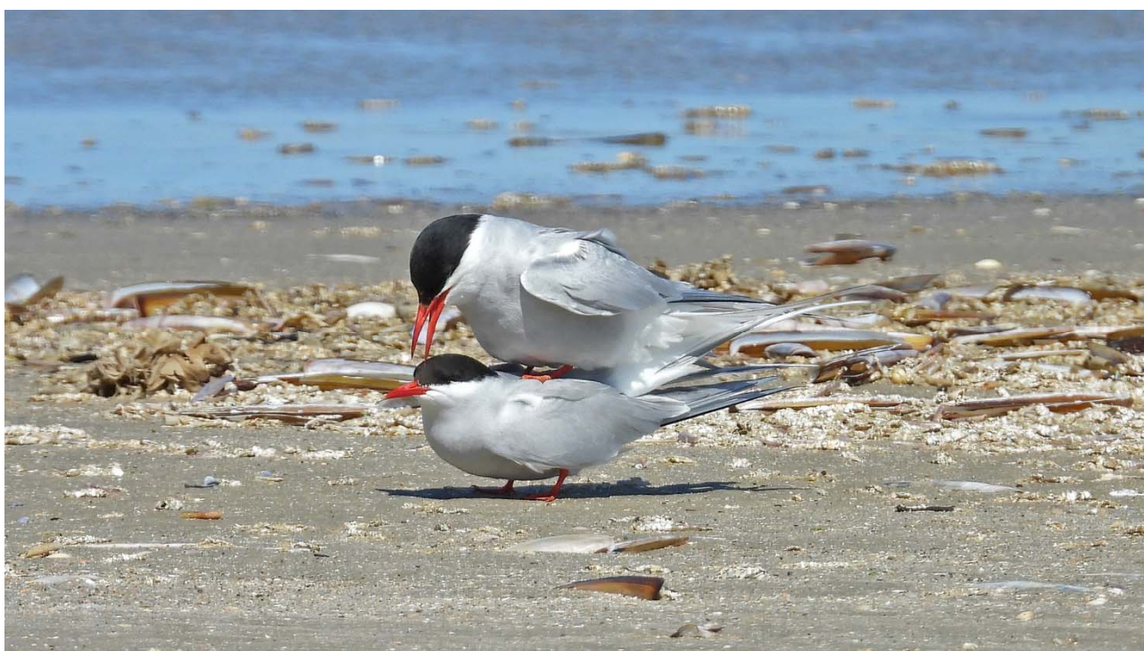
Foto 1. Et havternepar på Juvre Sand gør klar til parring, 13. juni 2019.

Det årlige optællingsprogram består af optælling af kolonirugende fugle, af nogle udvalgte fåtallige arter af vadefugle i hele Vadehavet og af alle vadefugle og andre udvalgte vandfuglearter i en række kontrolområder. I Danmark er der 11 kontrolområder. Hvert sjette år, næste gang i 2024, udvides programmet til at inkludere alle ynglende vadefugle, måger og terner samt enkelte andre arter, der optælles på samtlige lokaliteter i Vadehavet.