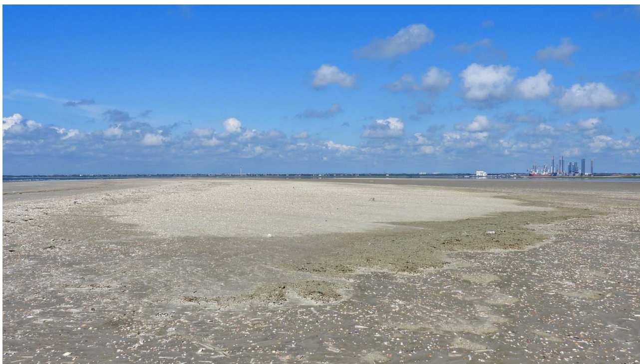
Foto 3. Det lille område på Søren Jessens Sand, der ikke blev overskyllet under oversvømmelsen 8. juni 2019. Alle dværgternereder lå uden for det tørre område på billedet, og blev skyllet bort. Enkelte reder af hvidbrystet præstekrave, stor præstekrave og klyde lå i det tørre område og overlevede det ekstreme højvande.

Der fandtes 360 ynglepar af klyder i Vadehavet i 2019 (Tabel 2). Årets antal og antallet i 2018 er mere end en halv gang flere par end i hvert af årene 2010-2017. Den væsentligste forskel i forhold til tidligere er, at der yngede 195 par i Margrethe Kog-Saltvandssøen i 2019, hvor der til sammenligning kun var hhv. 23, 17, 19 og 51 par i 2015, 2016, 2017 og 2018. Før 2010 var der dog væsentligt flere ynglende klyder i Vadehavet. Flest registreredes i 1991 med 1133 par, næstflest i 1999 med 973 par.