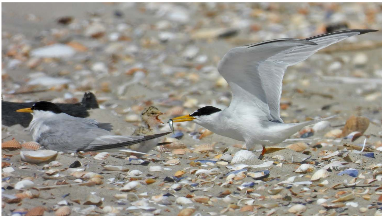
Foto 2. En dværgterne fodrer sin unge på Søren Jessens Sand, 6. juli 2019. Forælderfuglen er mærket med grøn farvering A24.

Fordelingen af dværgterner på de enkelte ynglelokaliteter varierer meget fra år til år. Den største enkeltkoloni i 2019 fandtes i skydeområdet på Juvre Sand, hvor der 23. maj optaltes 34 par. Efter oversvømmelsen 8. juni voksede kolonien sig væsentligt større, og 10. juni sås her fugle svarende til 76 par (i overensstemmelse med den tekniske anvisning ganges antal individer med 0,7). De par, der flyttede til Juvre Sand, endte med at få en god ynglesucces. Den næststørste koloni lå på Langejord, og de 29 par her er det største antal, der er registreret på lokaliteten.