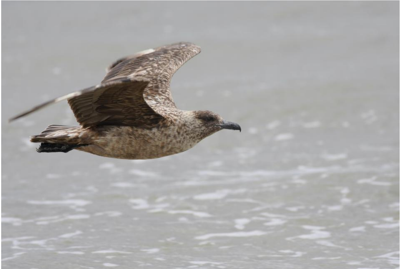
Storkjove, adult, Blåvandshuk den 31. august 2017.

Melder DMI om en vinterstorm, helst fra sydvest eller vest, og har man sig en god varm kedeldragt, skal man ikke være bange for at prøve sig af på en havobs... Vinterstorme kan producere en del Rødstrubede Lommer, og mellem dem kan man være heldig at få en Islom. Hvis man er rigtig heldig, så kan man også få en Mallemuk eller Storkjove i notesbogen. Det man mest ser, er dog et stort træk af Sorttænder. Det er ikke et rigtigt træk, men mere et kompenstræk hvor fuglene er blevet drevet af vind og strøm i løbet af natten, og så atter vil op til de gode fødeområder... Alkefugle er der ikke så mange af, dog kan man sagtens få sig et par Lomvier og Alke. Man ser ikke mange småfugle i vintertiden. Omkring Fyret ses der lidt rastende Solsorte, Jernspurve og Gærdesmutter, men er vinteren mild, er der til gengæld næsten altid overvintrende Sortstrubet Bynkefugl i området.