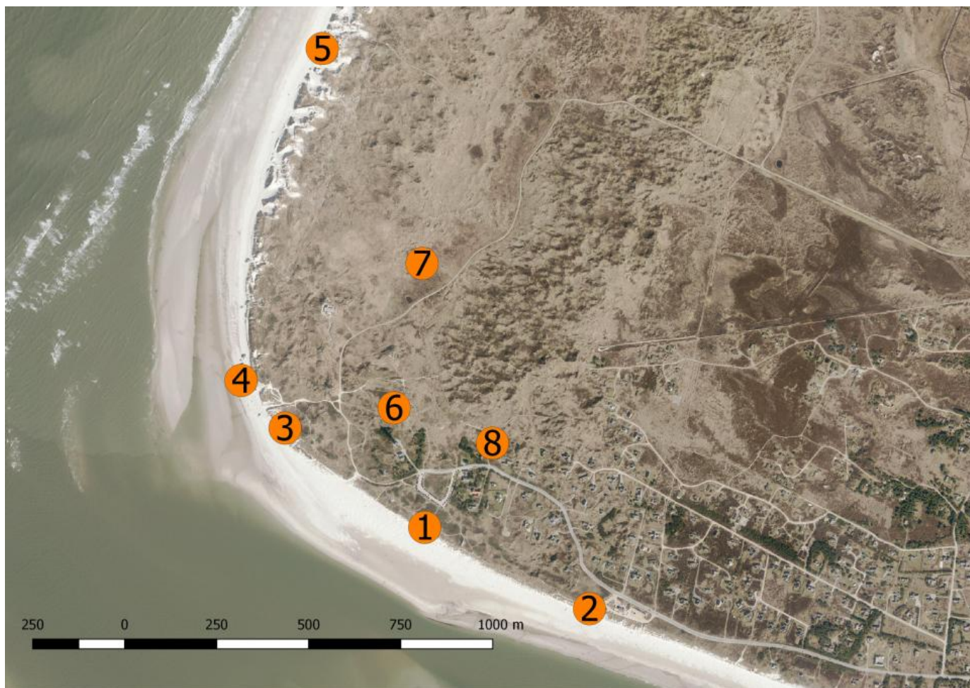
Oversigtskort over Blåvandshuk med de bedste observationsposter. 1: Sydhukket: Man står i SØ-klitten helt ude ved P-pladsen ved Fyret 2: Ishuset: 500 m syd for obspunktet i SØ-Klitten/Fugletationen. 3: Den høje klit syd for Pælerækken, lige syd for det grønne militærtårn. 4: Nordhukket: Fra pælerækken/det grønne militærtårn og videre nord på. Det er det område, der kan være lukket pga. af militærøvelse. 5: Sabinebunkeren: Ligger placeret ca. 1 km. nord for pælerækken på Nordhukket. 6: Bakke nord for Fyret: Den ligger 50-70 m nord for selve Fyret, man kan overskue heden og har udsigt over hele mosen. 7: Mosen: Det område der ligger 500 m N for Fuglestationen/P-pladsen. Her