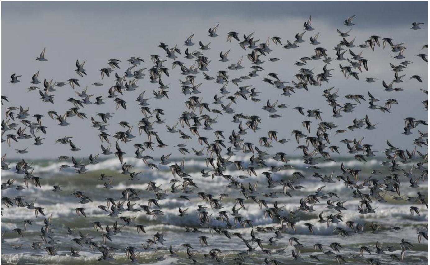
Sandløbere, Blåvandshuk den 28. april 2017.

Næsten som i selve træktiden er vinteren ofte afhængig af, hvordan vindretningen er. I lange perioder med vind fra det kolde nordøstlige hjørne og hård frost kan Hukket være støvsuget for fugle. Men heldigvis er klimaet generelt mere lunt ved Nordsøen, og ofte er det vinde fra en vestlig retning, der dominerer. Er vinden ikke så kraftig, kan man nyde mange rastende Sortænder på Hukket. Især omkring Ishuset kommer de meget tæt på i år, hvor der er meget føde. Det er ikke ualmindeligt med mange tusinde rastende fugle, man regner således med, at der raster over 100.000 fugle ud for Blåvand. Hovedparten er dog så langt til havs, at man ikke ser dem. Et andet sted, hvor de ofte opholder sig i roligt vejr, er på Nordhukket, ud for den gamle tyske bunker, som går under navnet "Sabinebunkeren". Mellem de mange Sortænder ses også tusindvis af Fløjlsænder og et mindre antal Havlitter. Hvis man har pudset sit teleskop rigtig godt, kan Brilleand og Amerikansk Sortand findes hvert år med nogen tålmodighed. På selve stranden er Sandløberen meget almindelig, og den overvintrer frem til sidst i maj, hvor den flyver videre til Grønland og Nordøstsibirien.