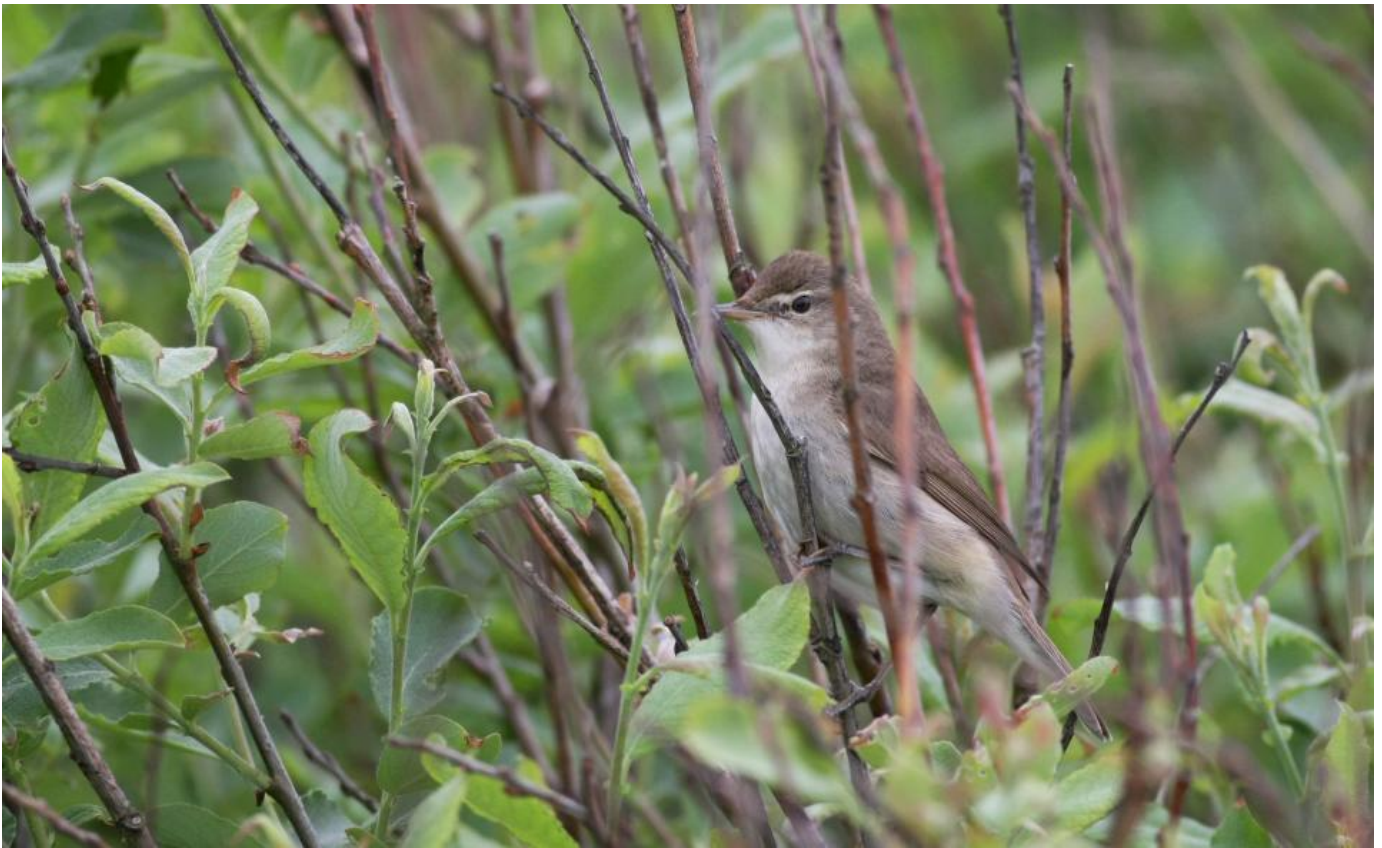
Buskrørsanger, Blåvandshuk den 25. maj 2016.