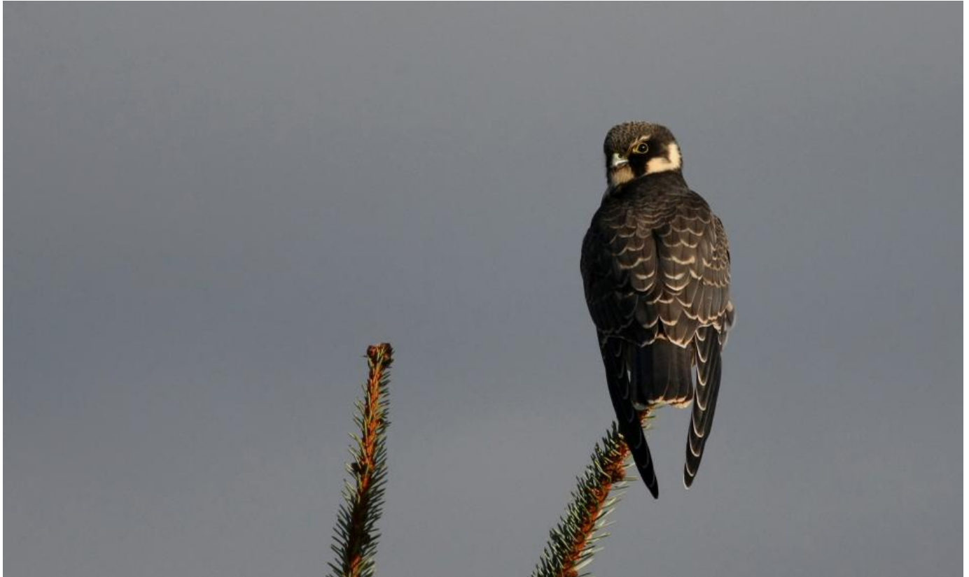
Lærkefalk, Blåvandshuk den 7. oktober 2016.

Når det ikke er havfuglevej, men mere svage vindretninger fra SV og SØ skal man stille sig højt oppe i klitrækken, da næsten alle de trækkende fugle kommer forbi der. Især er den høje klit, lige syd for pælerækken, et populært sted, hvorfra man kan følge trækket over havet såvel som inde over baglandet, hvor især mange af gæssene og rovfuglene flyver. I selve klitten kan man hele september og oktober opleve et flot småfugletræk, hvor tusindvis af pibere og finker flyver forbi. Årligt pilles den sjældne Storpiber ud mellem de øvrige småfugle. Hvis man gerne vil forsøge sig med noget mere rovfugletræk, så kan det anbefales at gå op på bakken nord for fyrtårnet. Herfra kan hele heden overskues, og i modsætning til om foråret er der et flot træk af rovfugle om efteråret. Især kan arter som Spurvehøg og Tårnfalk forekomme i store antal, men der ses også mange Dværgfalke, Vandrefalke og næsten årligt endda Steppehøg de senere år.