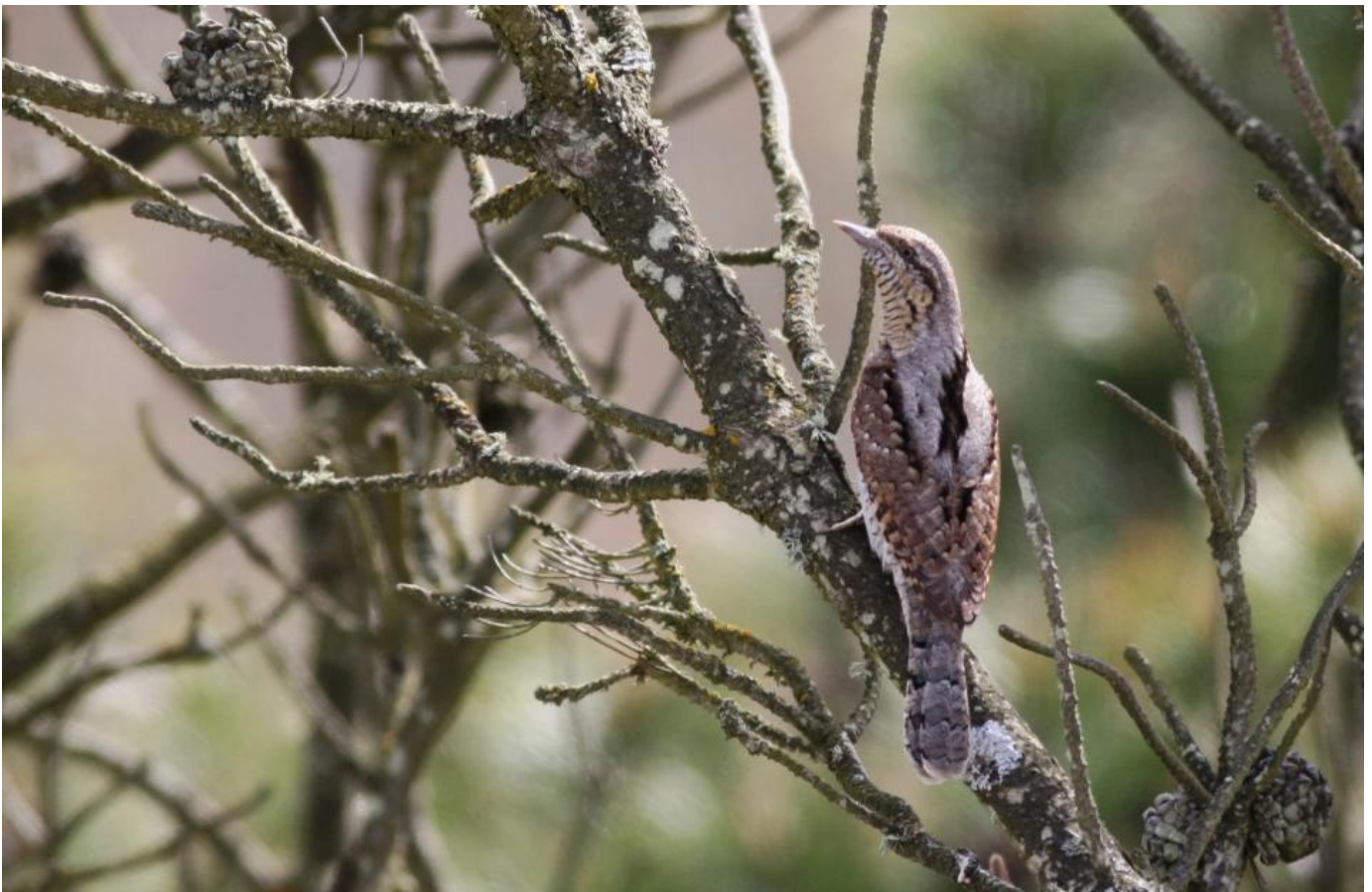
Vendehals, han, Blåvandshuk den 9. maj 2017.

Det tidlige forår kan på regnfulde og lune dage i marts byde på massivt fald af Solsorte. Der kan løbe flere hundrede rundt på parkeringspladsen ved Fyret. Senere tikker alle de mange afrikatrækkere ind. I april kan man finde de første Vendehalse. De ses ofte omme på grusvejen ved Vesterled, og i de seneste to år høres de ofte synge, da de er begyndt at yngle på Hukket.