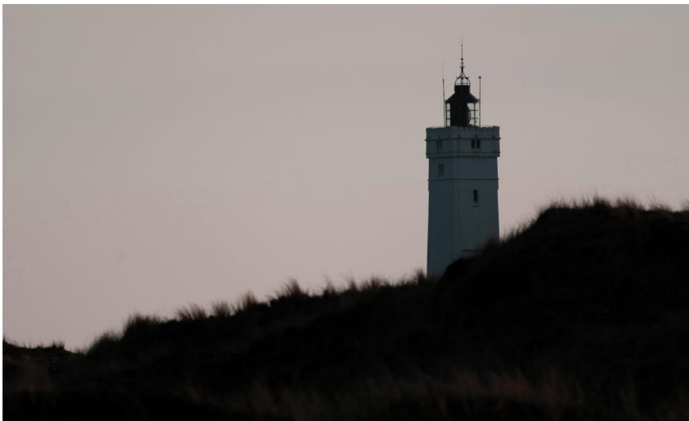
Blåvand Fyr. En flot aprilaften den 15. april 2016.