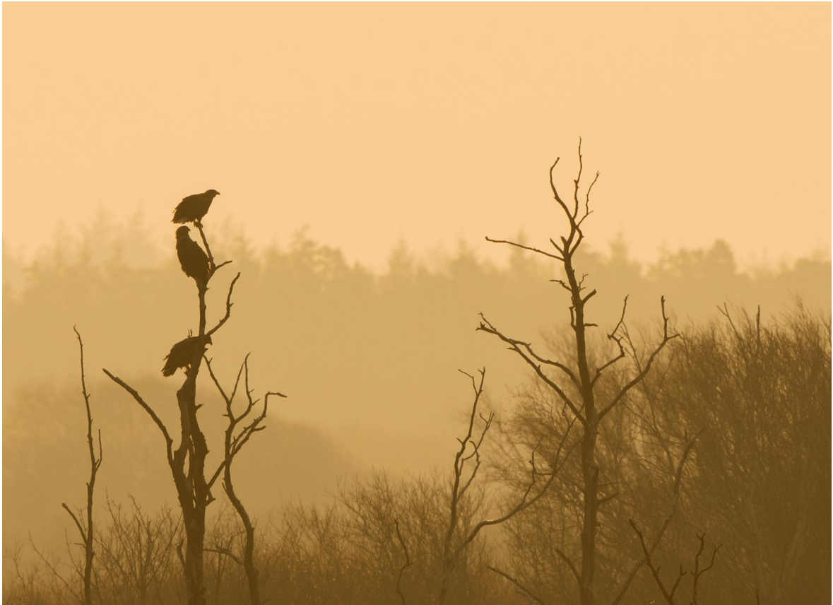
De to gamle Havørne og en af ungerne i "Skarvtræerne".

Også i år har vi haft et eksemplarisk samarbejde med Naturstyrelsen. Det har igen været glædeligt at mærke deres store interesse for ørneparret.